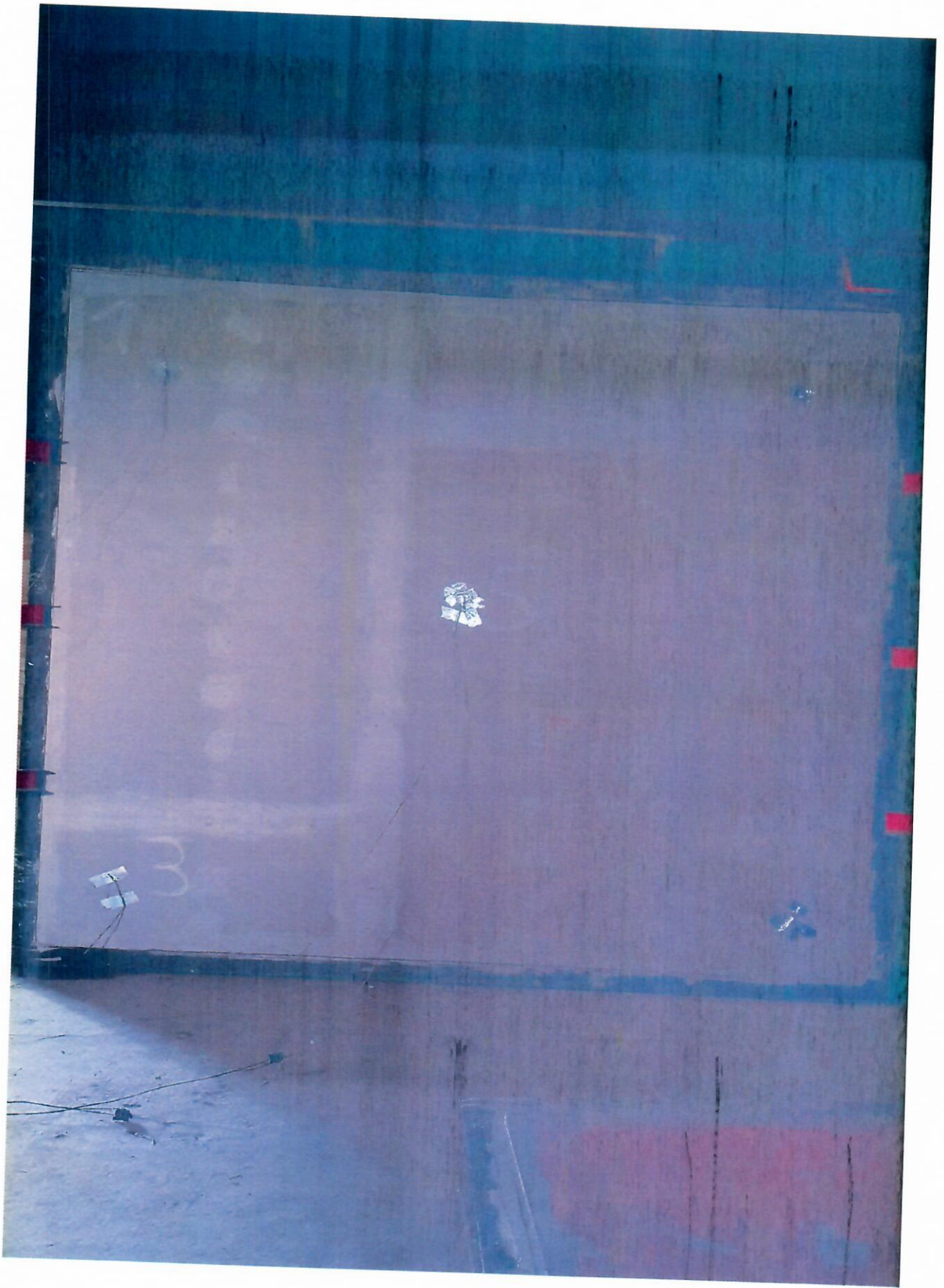
100 минута испытаний