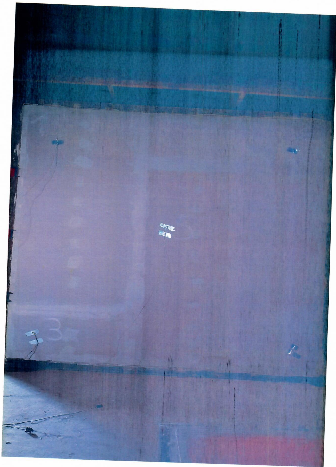
60 минута испытаний